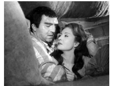
1955 CHÉRI-BIBI de Marcello Pagliero avec Jean Richard