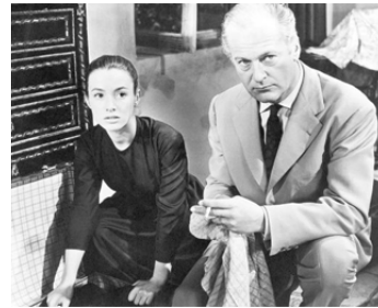
1956 ŒIL POUR ŒIL d'André Cayatte avec Curd Jürgens