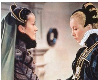
1960 LA PRINCESSE DE CLÈVES de Jean Delannoy avec Marina Vlady