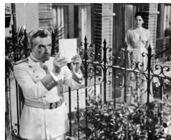
1958 PAIN, AMOUR ET ANDALOUSIE de Javier Setó avec Vittorio De Sica