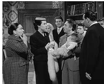
1954 LA FEMME EST LA MÊME POUR TOUS de G. Simonelli avec Nino Taranto