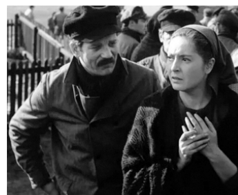
1963 GERMINAL d'Yves Allégret avec Zoltan Maklary