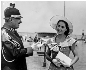
1955 PAIN, AMOUR ET JALOUSIE (Pane, amore e gelosia) de L. Comencini avec V. De Sica