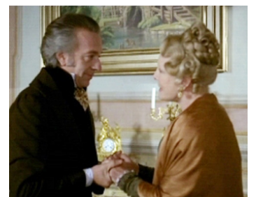
1982 EHRENGARD d'Emidio Greco avec Jean-Pierre Cassel