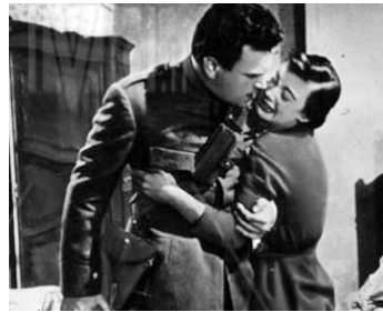
1954 FEMMES ET SOLDATS (Guai ai venti !) de Raffaello Matarazzo avec Pierre Cressoy