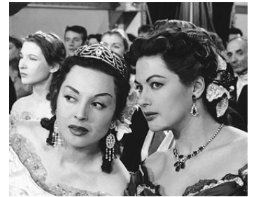
1954 LA CASTIGLIONE (La contessa di Castiglione) de Georges Combret avec Yvonne De Carlo