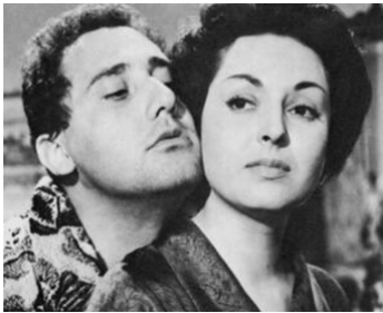
1954 LE SÉDUCTEUR (Il Seduttore) de Franco Rossi avec Alberto Sordi