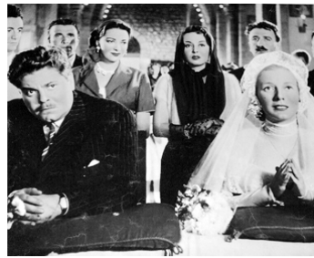
1953 FEMMES DAMNÉES (Donne proibite) de Giuseppe Amato avec O. Welles, V. Cortese