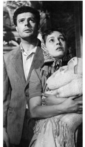
1953 QUELQUES PAS DANS LA VIE (Tempi nostri) d'Alessandro Blasetti avec Marcello Mastroianni