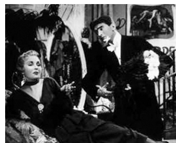
1953 DRÔLES DE BOBINES (Cinema de altri tempi) de Steno avec Walter Chiari