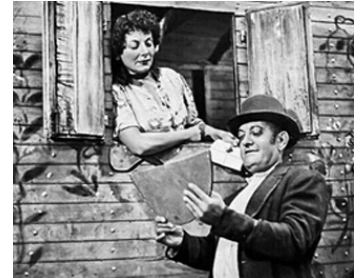
1951 LES DEUX GOSSES (I due Derelitti) de Flavio Calzavara avec Yves Deniaud