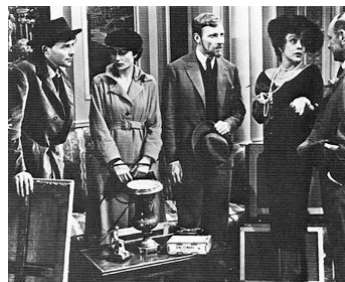
1958 MONTPARNASSE 19 de J. Becker avec Gérard Philipe, Anouk Aimée, Gérard Sety