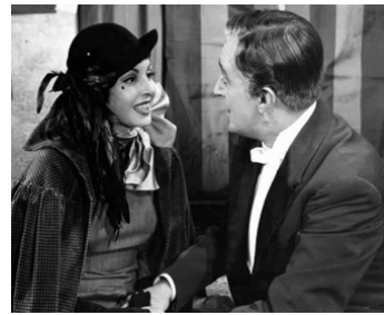
1953 AMOURS D'UNE MOITIÉ DE SIÈCLE (Girondola 1910) d'Antonio Pietrangeli