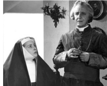
1950 POUR LE BONHEUR DE SA FILLE (La grande rinuncia) d'Aldo Vergano avec Luigi Pavese