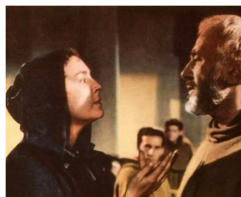
1962 MIRACLE À CUPERTINO (The reluctant Saint) d'E. Dmytryk avec Harold Goldblatt