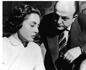
1955 LE DOSSIER NOIR d'André Cayatte avec Bernard Blier