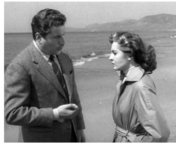
1956 L'INTRUSE (Catene amare) de Raffaello Matarazzo avec Amedeo Nazzari