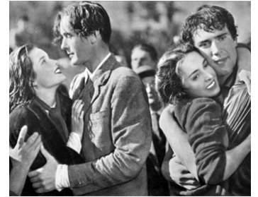
1950 DUE MOGLI SONO TROPPO de M. Camerini avec Sally A. Woren, Gr. Jones, Kieron Moore