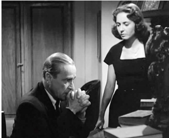
1950 ACTE D'ACCUSATION (Atto d'accusa) de G. Gentilomo avec Karl Ludwig Diehl