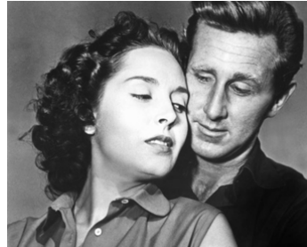
1950 TROIS PAS AU NORD (Three Steps north) de W. Lee Wilder avec Lloyd Bridges