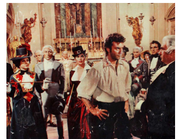
1959 LA MAJA NUE (La Maja desnuda) d'Henry Koster avec A. Gardner, A. Franciosa, G. Cervi