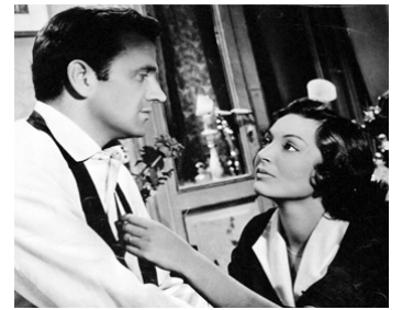
1954 LA TUA DONNA de Giovanni Paolucci avec Massimo Girotti