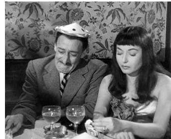
1951 TOTÒ ET LES FEMMES (Totò e le donne) de Steno & Mario Monicelli avec Totò