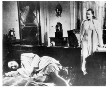
1946 LE SOLEIL SE LÈVERA ENCORE (Il Sole sorge ancora) d'Aldo Vergano avec Elli Dott