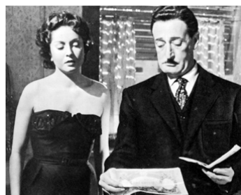
1953 UNE DE CELLES-LÀ (Una di quelle) d'Aldo Fabrizi avec Totò