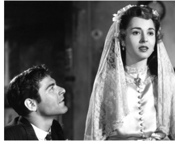
1949 DONNEZ-NOUS AUJOURD'HUI (Give us this Day) d'E. Dmytryk avec Sam Wanamaker